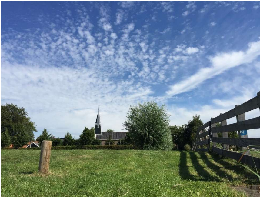
Dit is het terrein, gezien vanaf de waterkant.

De muziek van de kopergroep is niet versterkt. Er worden geen berichten o.i.d. omgeroepen via speakers. De voorganger gebruikt een microfoon en er staan twee geluidsboxen links en rechts van de voorganger. Per viering zijn één of twee muziekfragmenten via de boxen te horen.