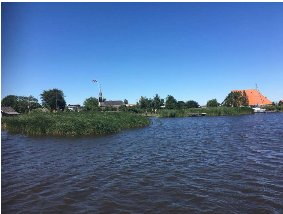
Terrein ligt aan het water